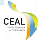
Latin American Business Council (CEAL)