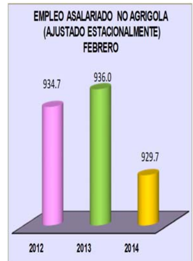
TABLA 1 EMPLEO TOTAL EN EL SECTOR NO AGRÍCOLA DE PUERTO RICO AJUSTADA ESTACIONALMENTE TOTAL NON FARM EMPLOYMENT IN PUERTO RICO SEASONALLY ADJUSTED

sectores que registraron bajas fueron: Gobierno (9,500); Minería, Tala y Construcción (3,400); Manufactura (1,600); Finanzas (600); Información (300) y Servicios Educativos y de Salud (200). Los sectores que registraron aumentos fueron: Servicios Profesionales y Comerciales (5,300); Recreación y Alojamiento (2,500) y Comercio, Transportación y Utilidades (1,500).